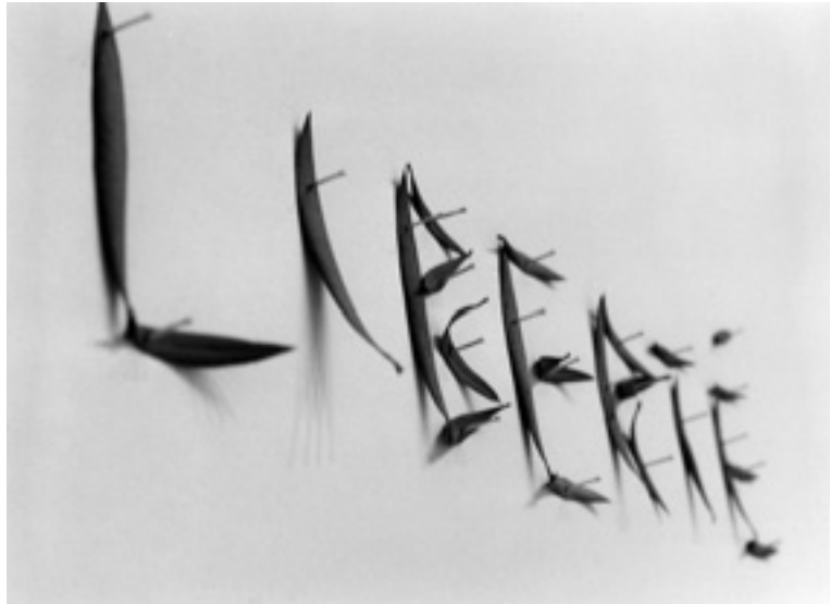
Die Liberté und das Geld

Soziale Plastik ist eine Entwicklungsidee, die auf die geistige Levitation des Individuums innerhalb gesellschaftlich förderlicher Rahmenbedingungen abzielt.