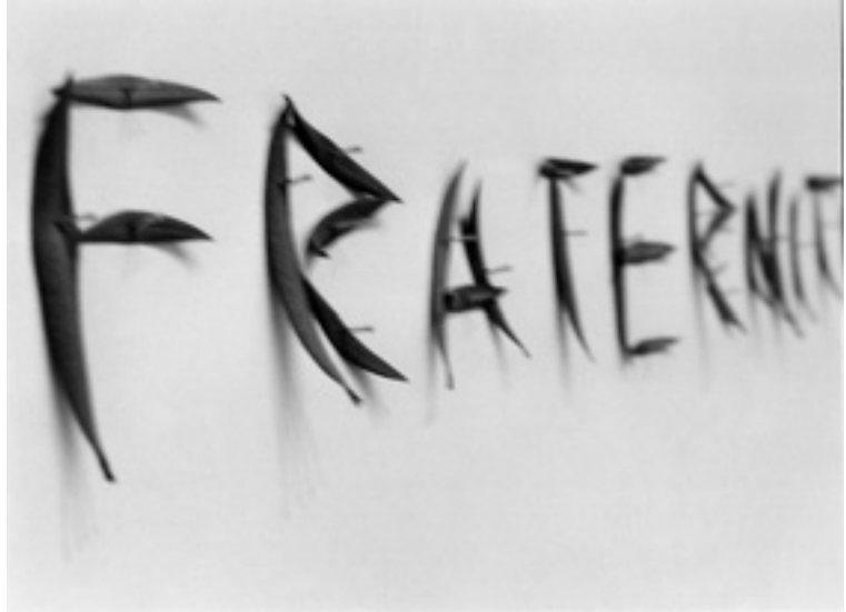
Die Fraternité und das Geld

In der amerikanischen Menschenrechtskonvention von 1948 gibt es unter Artikel 21 einen selten zitierten Paragraph, der Wucher und jede andere Form der Ausbeutung des Menschen durch den Menschen verbietet. Man hat leider nie gehört, daß sich Amnesty International oder eine andere Menschenrechtsorganisation der Verfehlung dieses Paragraphen angenommen hätte. Sie hätten auch alle Hände voll zu tun, wollten sie in einem System des gnadenlosen wirtschaftlichen Konkurrenzkampfes damit Ernst machen.