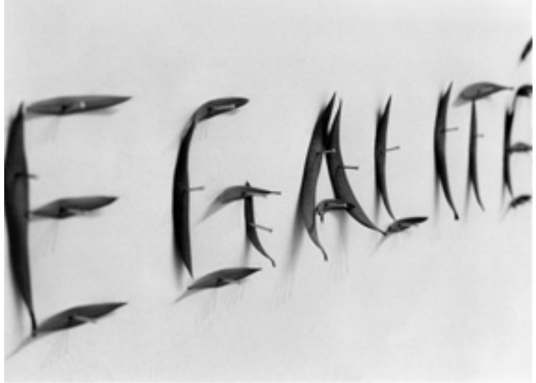
Die Egalité und das Geld

Der Mensch, der als Ich-Wesen seine Liberté realisieren möchte, steht im gesellschaftlichen Rahmen anderen Ich-Wesen gegenüber. Solange er dieses Verhältnis in Eintracht auslebt, stellt sich die Frage des Rechts nicht. Denn sobald sich letztere stellt, ist schon Unrecht geschehen. Oder exakt: Unrecht ist empfunden worden. (Der metaphysische Ort der Empfindung ist die Brust, in der bekanntlich nicht eine, sondern 2 Seelen wohnen: Polarität.)